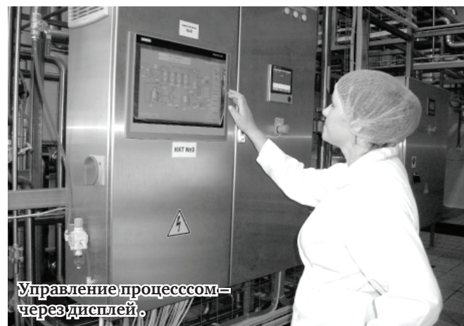
Управление процессом – через дисплей.

Примечательная деталь: после цикла работы с выпуском ста тонн продукции всё оборудование в автоматическом режиме подвергается санитарной обработке – промывке всех систем.