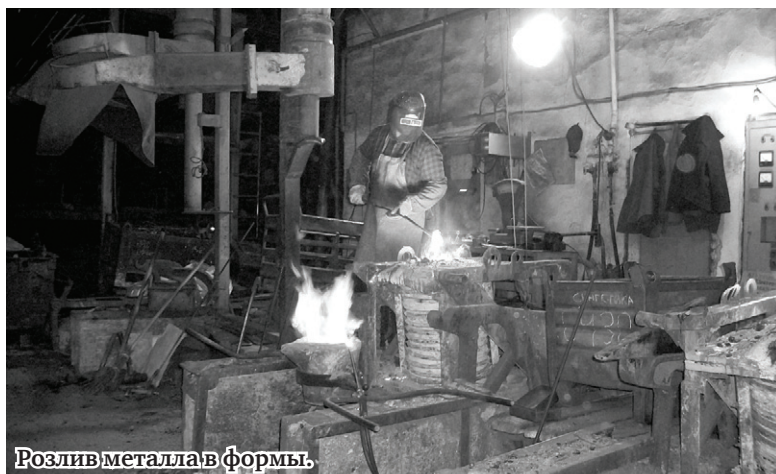
Розлив металла в формы.

– Наверное, практики маловато, – размышляю вслух, – тем более что и учёба-то не была напрямую связана с рабочей профессией.