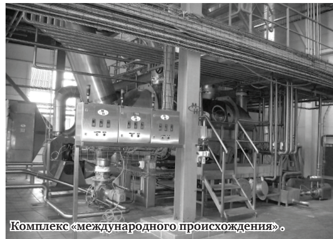
Комплекс «международного происхождения».

Другой отличительный момент: запущенный здесь в эксплуатацию в декабре минувшего года новый корпус по производству сухого молока в двадцать три метра «ростом» – самый приметный в посёлке, выше него только мачты сотовой связи.