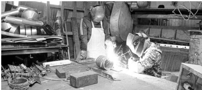
Обучение профессии при опытном наставнике дорогого стоит

По словам авторов обращения, УТЦ никогда не испытывал такого организационного провала и потери