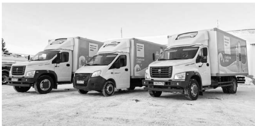
Часть новой партии – автомобили ГАЗель

Нынешнее обновление автопарка можно считать беспрецедентным, отмечают в пресс-службе предприятия. В прошлые года приобреталось максимум по 3-4 единицы техники, в этом году сразу 20! Новые россий-