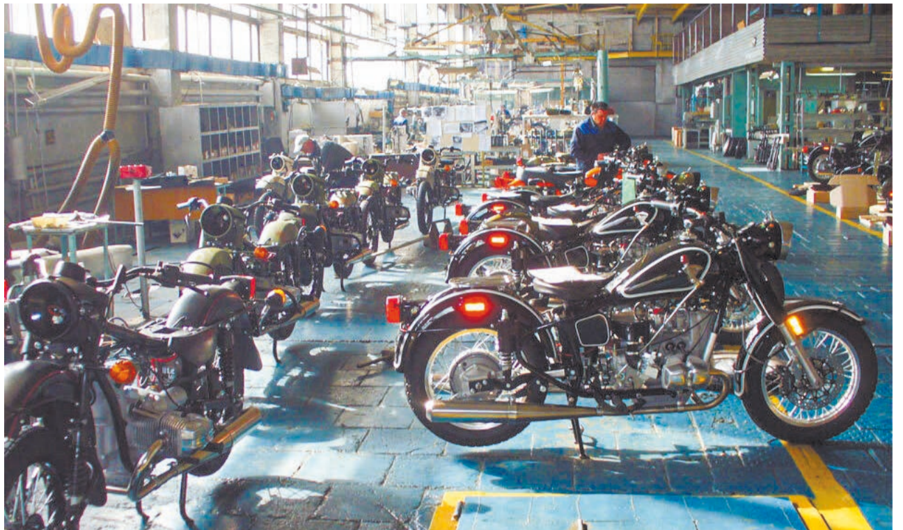
Лимитированную серию мотоциклов для викторины уже собирают на производстве

– Изначально планировалось, что квартир будет 40, машин – 90 и смартфонов – 1000. Но свердловские благотворители с таким воодушевлением отнеслись к идее