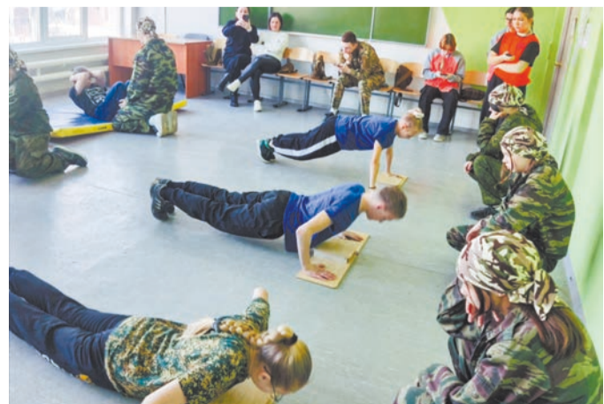
Один из этапов игры – физподготовка

В Ирбите на базе гуманитарного колледжа прошла окружная комплексная военно-патриотическая игра «Доблесть» при поддержке областного министерства образования и молодежной политики. В ней приняли участие 22 команды школьников и студентов с разных территорий Восточного управленческого округа.