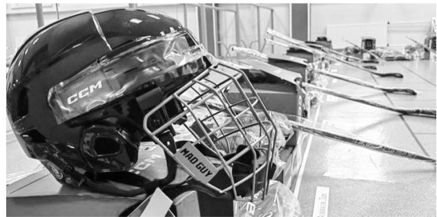
С помощью инициативного бюджетирования муниципалитеты регулярно приобретают экипировку для спортивных команд

Качественно исполненные уральские проекты отмечены на федеральном уровне. Так, в прошлом году победителем Всероссийского конкурса проектов инициативного бюджетирования в номинации «Общественное партнерство» стала детская спортивная площадка «Джунгли» в поселке Верхняя Синячиха Алапаевского района.