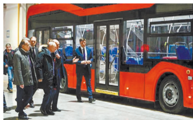
Владимиру Путину показывают новый троллейбус от «Уральских локомотивов»

Напомним, что по поручению президента России с 2022 года по всей стране реализуется федеральная программа модернизации школьных систем образования. Только в Свердловской области за этот период было отремонтировано 48 зданий школ. В 2024 году капремонт будет проводиться в 15 школах, на эти цели направлено свыше миллиарда рублей.