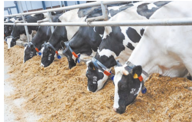
Сельхозкооператив много лет успешно занимается и животноводством, и земледелием