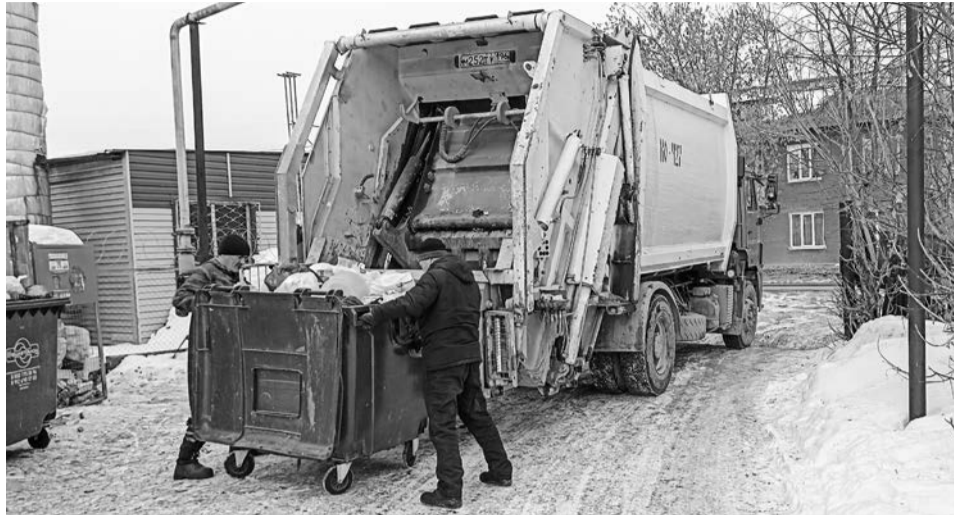
Очистка контейнеров производится по графику в соответствии с санитарными правилами

Как в Ирбите организована уборка контейнерных площадок и какие штрафы ждут жителей за «свинство» на улице