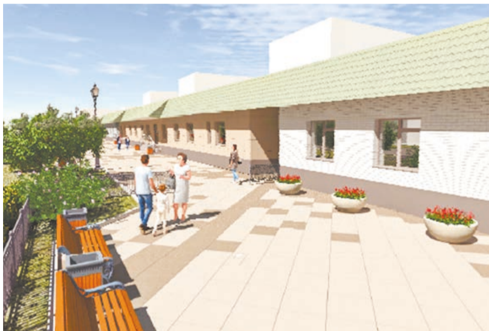
Новый облик четной стороны улицы Елизарьевых