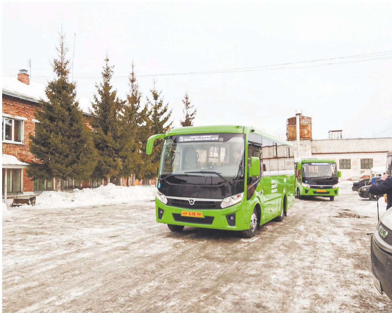
Новые автобусы выезжают на маршруты с предприятия «Ирбит-Авто-Транс»