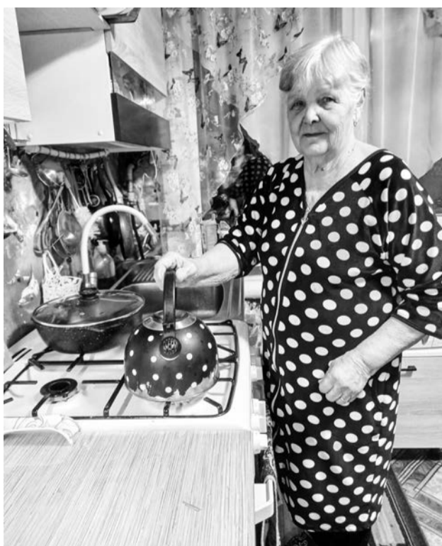
Газ в частном доме – гарантия комфортного быта

Подать заявки на участие в программе социальной догазификации можно через сайт «Госуслуги» или в офисе АО «Регионгаз-инвест» по адресу: улица Логинова, 44, телефон: 6-32-42.