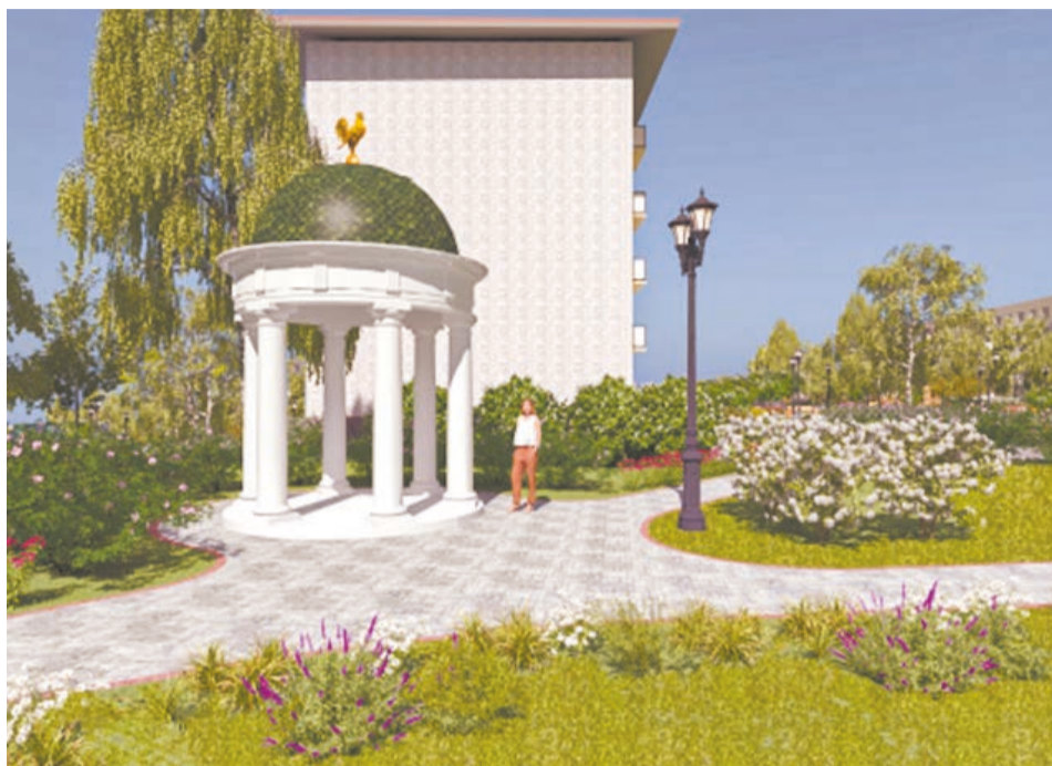
Так будет выглядеть ротонда в благоустроенном сквере на Серебрянке