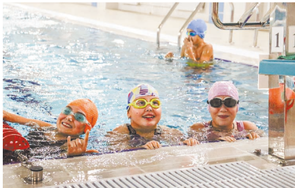
В 25-метровом бассейне регулярно занимаются плаванием не только взрослые, но и дети