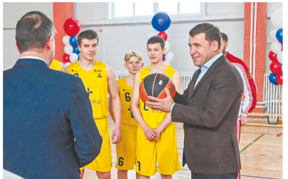
В марте 2023 года Евгений Куйвашев, открывая ФОК «Олимпиец», подписал мяч местной баскетбольной команде

Во втором здании ФОКа функционирует спортивный зал, где организованы оздоровительные и тренировочные занятия по мини-футболу, волейболу, баскетболу и общей физической подготовке. Активно работает секция детского футбола для детей Ирбита и Ирбитского района в возрасте 5–7 лет.