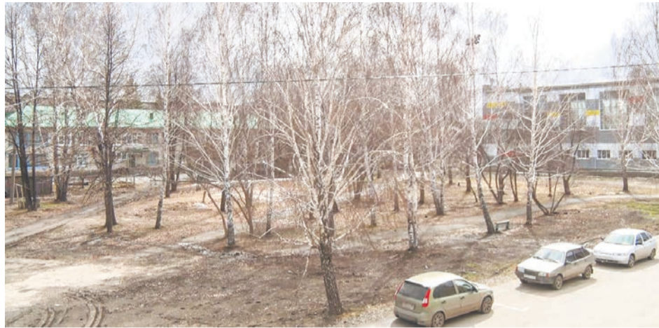
Березовую рощу у стадиона «Юность» будут благоустраивать в этом году, за нее проголосовало большинство ирбитчан