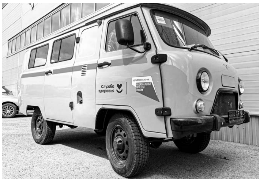
На новых УАЗах написано «Служба здоровья» и «Нацпроект «Здравоохранение»

31 января в Екатеринбурге прошла торжественная церемония вручения ключей от новых автомобилей медицинским учреждениям региона. 41 машина марок «Лада Гранта», «Лада Нива» и УАЗ были закуплены в рамках региональной программы «Модернизация первичного звена здравоохранения Свердловской области». Транспорт получили в общей сложности 35 больниц, в том числе Ирбитская ЦГБ.