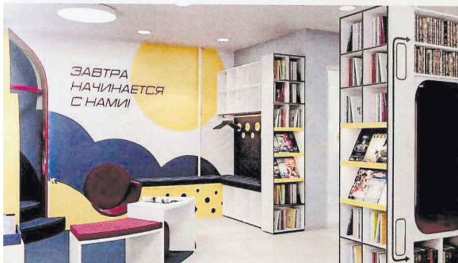
Так будет выглядеть зона выдачи детских книг после обновления библиотеки

Торжественное открытие запланировано на конец сентября этого года. Уверена, что посетители тоже будут в восторге, когда оценят перемены.