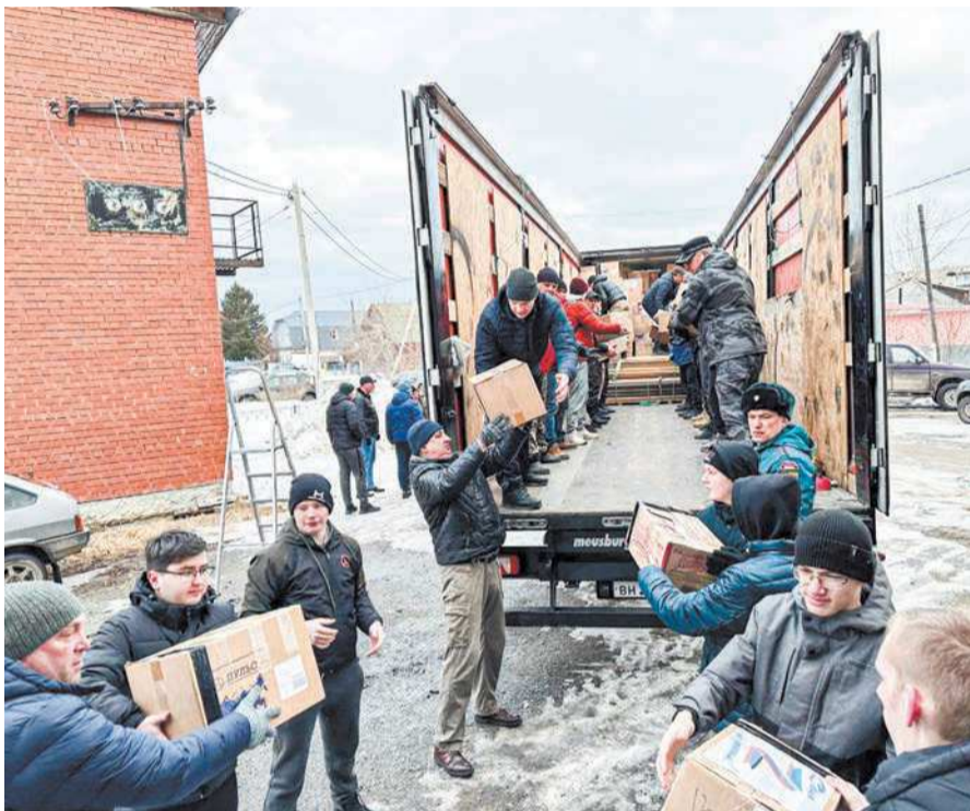
В сборе ценного груза участвовали жители Ирбита и Ирбитского района, Тавды, Тугулыма, Туринска, Байкаловского района и других территорий

– Спасибо неравнодушным жителям, а также предпринимателям, которые несмотря на сложное санкци-