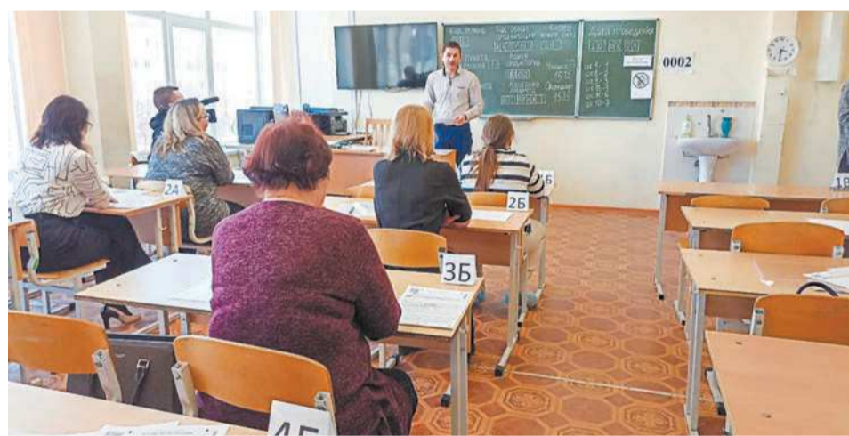
Родители сели за школьные парты

День сдачи ЕГЭ родителями прошел в ирбитской школе № 10 в рамках Всероссийской акции «Сдаем вместе!». Папы и мамы будущих выпускников школы прошли всю процедуру сдачи экзамена – от регистрации и проверки металлоискателем до получения результатов ЕГЭ. Также родители познакомились с системой контроля за объективностью проведения экзамена и узнали, каким образом идет печать и сканирование контрольных измерительных материалов.