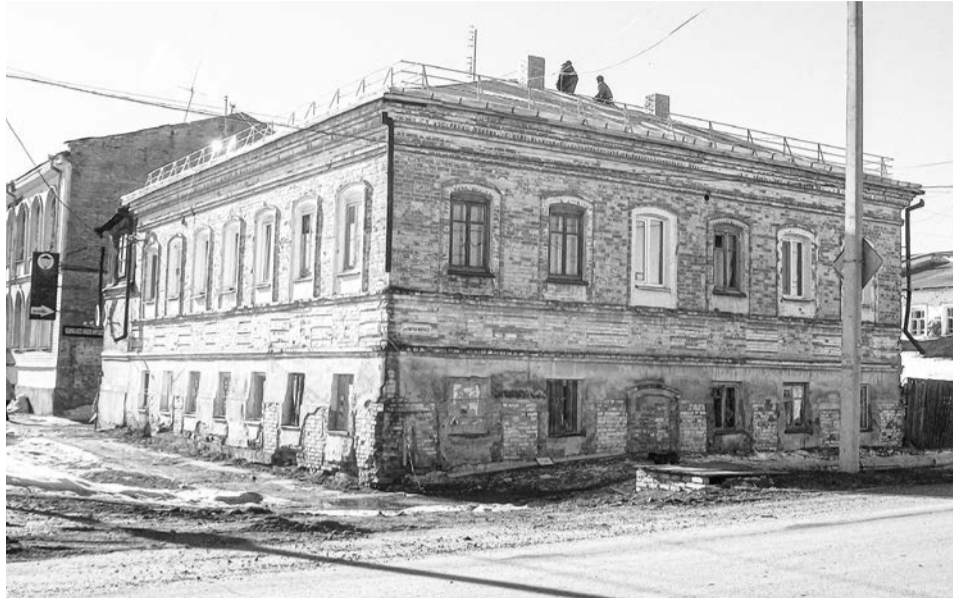
Крыша дома давно требовала ремонта

В Ирбите за счет областного бюджета ремонтируют многоквартирный дом