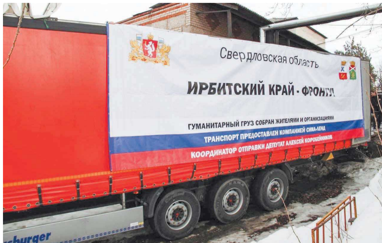
На каждой фуре указано, откуда груз