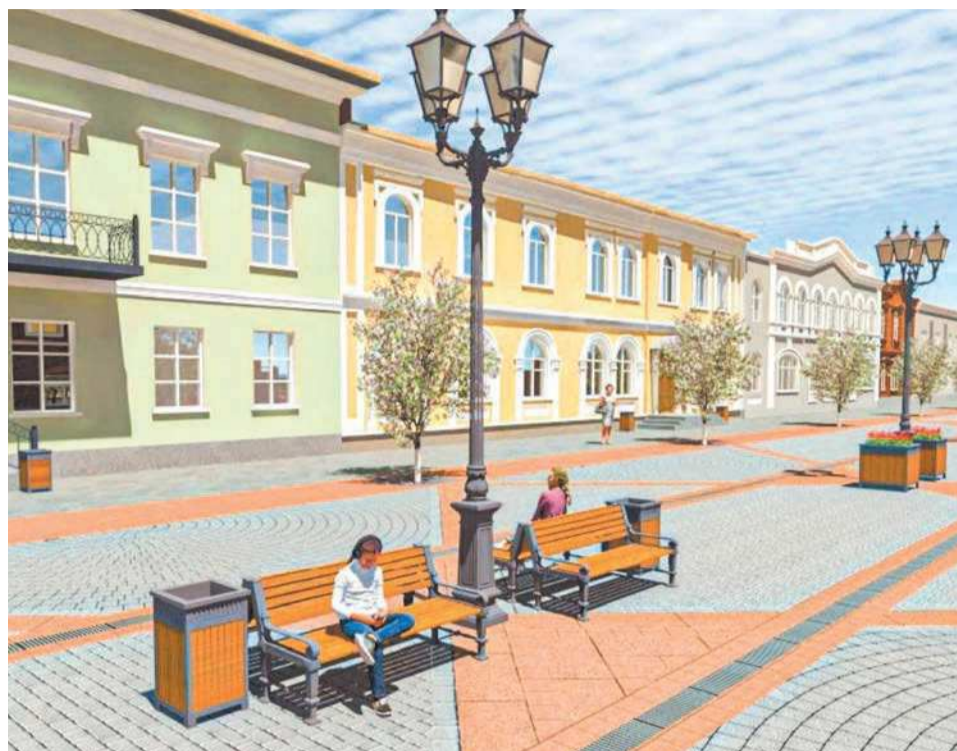
Так будет выглядеть улица после благоустройства

Администрация Ирбита объявила электронный аукцион по выбору подрядчика, который займется благоустройством улицы Красноармейской от Ленина до Орджоникидзе. Первоначальная цена контракта – почти 94 млн рублей.