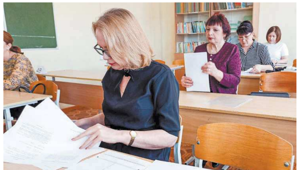
Разобраться с бланками для экзамена не так-то просто