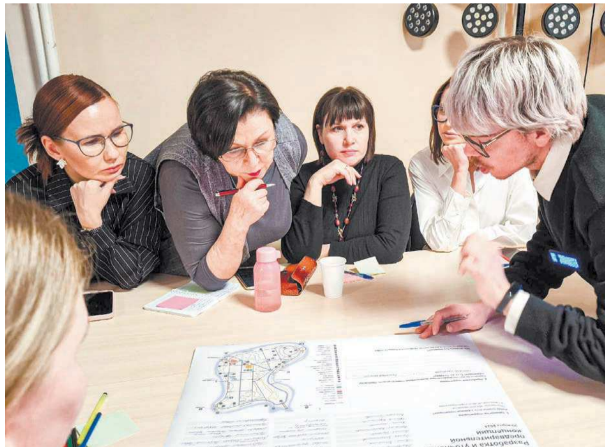
Мозговой штурм разработчиков проекта

Проект благоустройства парка 40-летия комсомола в Ирбите вновь заявляют на всероссийский конкурс