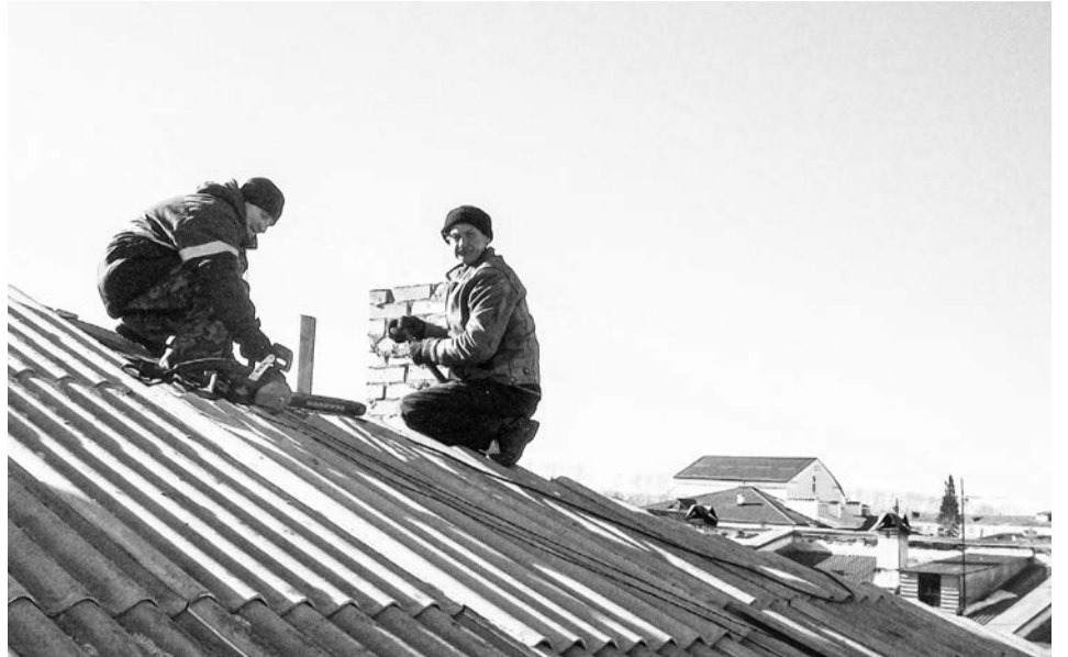
Подрядчики за работой

Бригада из четырех человек намерена выполнить производственное задание к концу второй декады апреля. Согласно проектно-сметной документации стоимость работ составляет 3,2 млн рублей. С учетом выявленных непредвиденных работ возможны корректировки сметы.