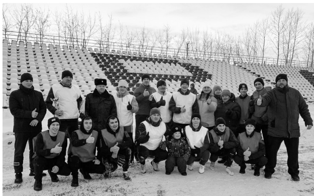
ОГИБДД МО МВД России «Ирбитский».

Инспекторы, в свою очередь, поблагодарили ребят за волю к победе и договорились в дальнейшем проводить товарищеские матчи и соревнования.