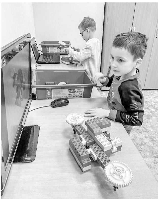
Будущих инженеров готовят с детского сада

Средняя заработная плата воспитателей детских садов составляет 52,3 тысячи рублей. Есть вакансии узких специалистов – педагогов-психологов и музыкальных работников.