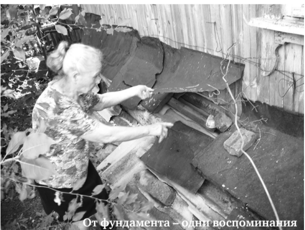
От фундамента – одни воспоминания

Администрация Городского округа «город Ирбит» Свердловской области