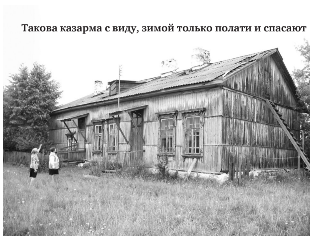
Такова казарма с виду, зимой только полаты и спасают