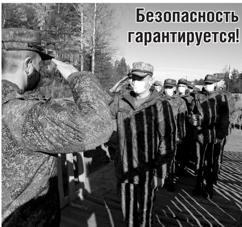
«Соблюдаются ли меры безопасности при прохождении призывной комиссии и непосредственно отправке? Что в военкомате говорят по этому поводу?».

Мы же открываем в газете рубрику «Добрососеди» и ждём от ирбитчан рассказов о своих замечательных соседях, которые обязательно опубликуем.