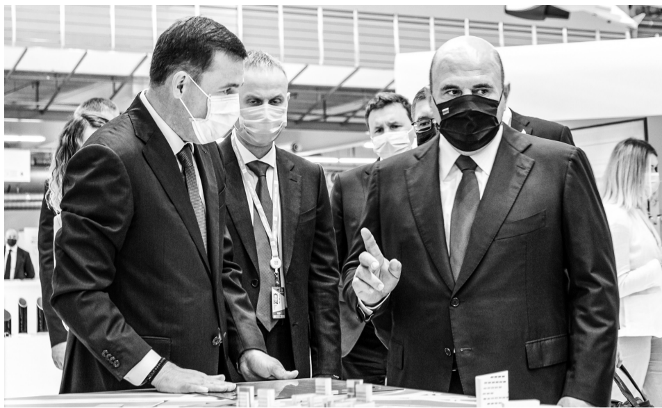
Председатель правительства России Михаил Мишустин обсудил с губернатором Свердловской области Евгением Куйвашевым проекты развития региона в ходе двусторонней рабочей встречи 5 июля.

Михаил Мишустин поздравил губернатора с открытием ИННОПРОМа и поблагодарил за мероприятие, отметив, что организовано оно на высоком уровне.