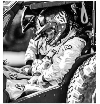
Следующие спортивные соревнования, в котором планирует принять участие команда Snag Racing, – Dakar 2022, которое пройдёт в начале января в Саудовской Аравии.

По информации департамента информационной политики Свердловской области.