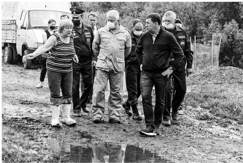
Губернатор Евгений Куйвашев 12 июля проверил ход аварийно-восстановительных работ в Верхней Салде, часть которой оказалась в зоне затопления вместе с территориями Нижней Салды и Горноуральского городского округа.

добавил, что недавно было принято решение о выделении более 700 миллионов на ремонт дорог в Свердловской области.