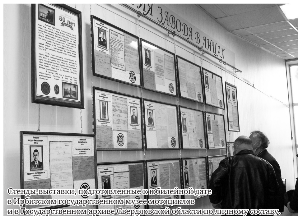
Стенды-выставки, подготовленные к юбилейной дате в Ирбитском государственном музее мотоциклов и в Государственном архиве Свердловской области по личному составу.

Подготовил к печати Лев ПОЛИЩУК.