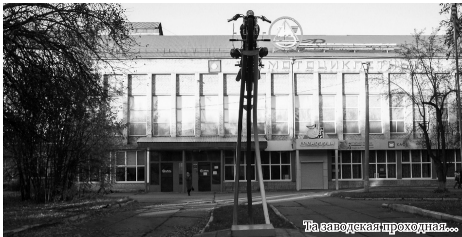
Та заводская проходная...

Пусть будет не хуже, чем в настоящее время.