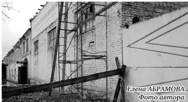
Елена АБРАМОВА. Фото автора.

На здании по улице Советской (бывшие цеха Ирбитского автоприцепного завода) проводится большой ремонт кровли взамен старой прохудившейся. Планируется использование здания под торговые точки.