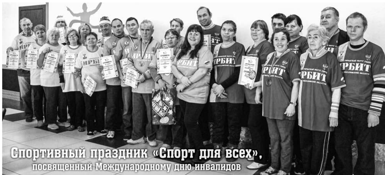
Спортивный праздник «Спорт для всех», посвященный Международному дню инвалидов

Праздник «Спорт для всех», посвященный Международному дню инвалидов, прошёл 8 декабря в спортивном павильоне стадиона «Юность».