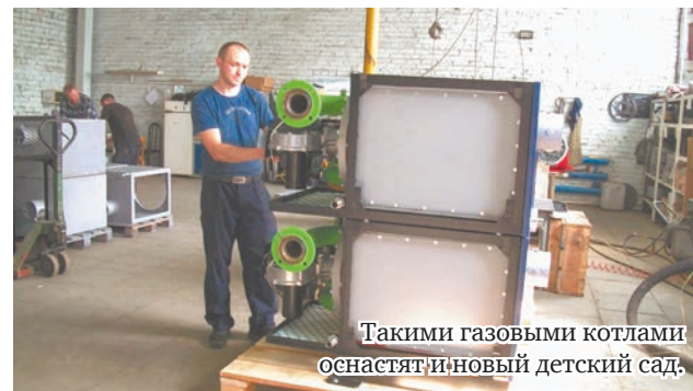
Таковыми газовыми котлами оснастят новый детский сад.

При нынешней необходимости импортозамещения значительно вырос спрос и на другой вид продукции – газовые отопительные котлы, используемые в том числе и для обогрева многоквартирных домов. Прежде изготавливали в месяц один-два, в планах на сентябрь – 18, октябрь – 24, ноябрь – 28... Среди заказчиков – крупные строительные компании Екатеринбурга и Москвы. К слову, и администрация нашего города намерена приобрести котлы для строящегося в микрорайоне «Комсомольский» детского сада на 270 мест.