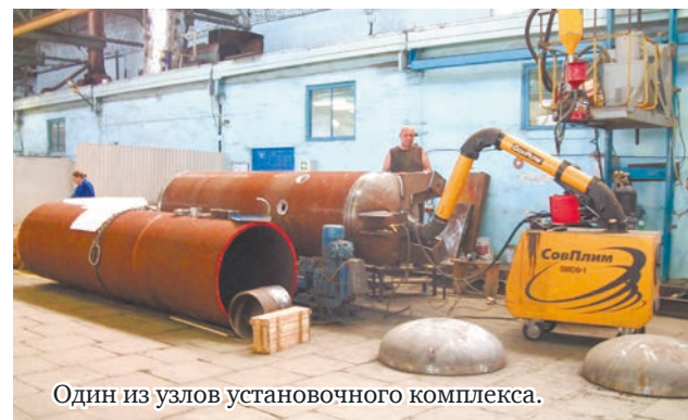
Один из узлов установочного комплекса.

На предприятии жёсткие требования не только к срокам, но и к качеству продукции, связанной с повышенными требованиями безопасности эксплуатации. С августа прошлого года в структуре «Газпрома» учреждено новое подразделение – ООО «Газнадзор» – аналог внешней Госприёмки, существовавшей в 80-90-е годы на промышленных предприятиях и постоянной – по заказам министерства обороны страны (как пример – военпреды на мотоциклетном и автоприцепном заводах).