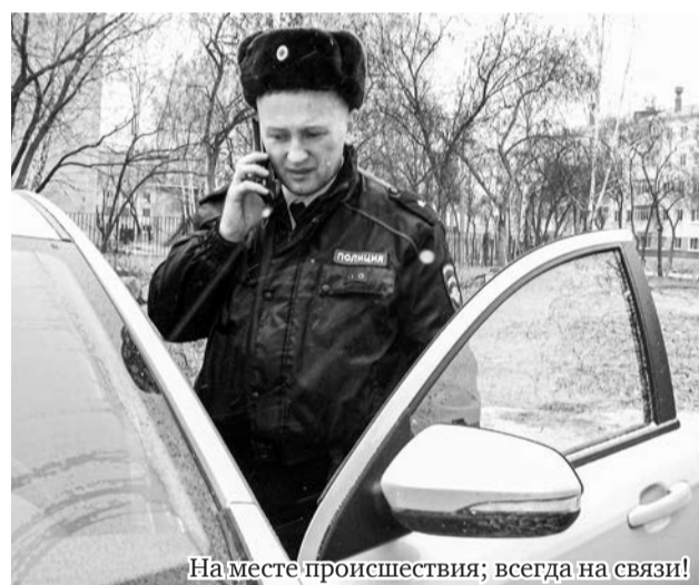
На месте происшествия; всегда на связи!