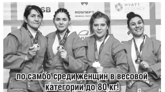
по самбо среди женщин в весовой категории до 80 кг!

На завершившемся 13 ноября чемпионате мира, который проходил в Бишкеке, в общей сложности был разыгран 21 комплект медалей – по 7 в мужском, женском и боевом самбо.