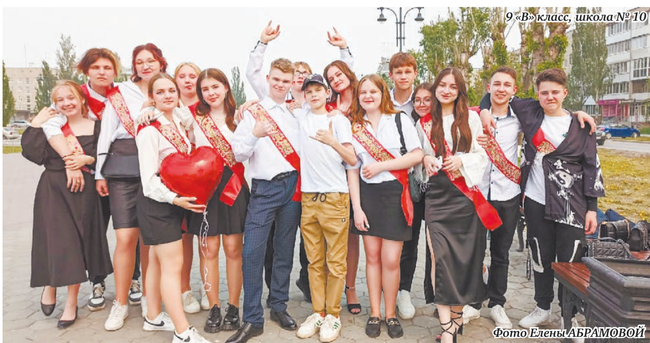
9 «В» класс, школа №10